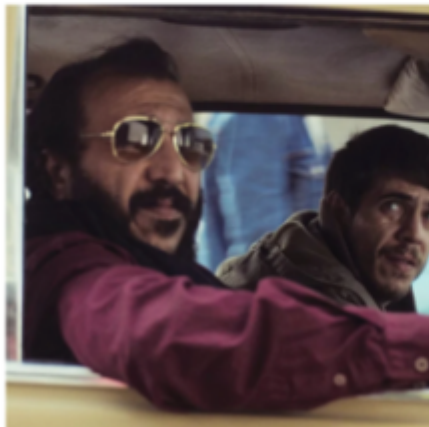
Once Upon a Time in Gaza