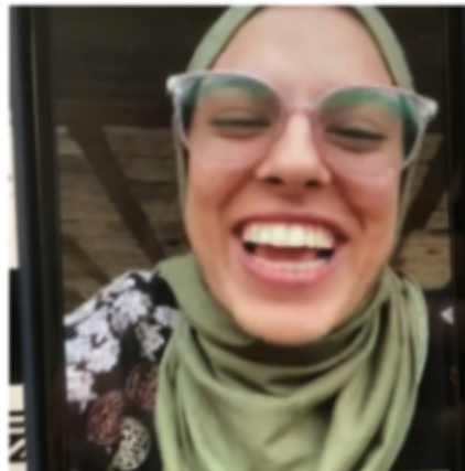
Put Your Soul on Your Hand an...