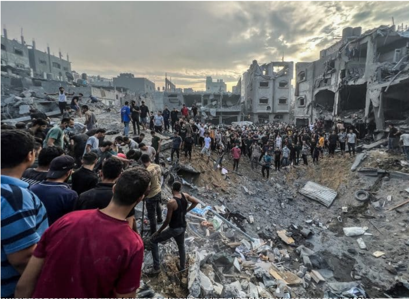
Palestinians search for survivors following an Israeli airstrike in the Jabalia refugee camp north of Gaza City, on October 31, 2023.

Chaque personne sur cette terre a une mission particulière. Le voyage commence par la recherche d'une réponse à la question du secret de son existence. Certains parviennent à le découvrir tôt, d'autres tard, et beaucoup ne le découvrent jamais.