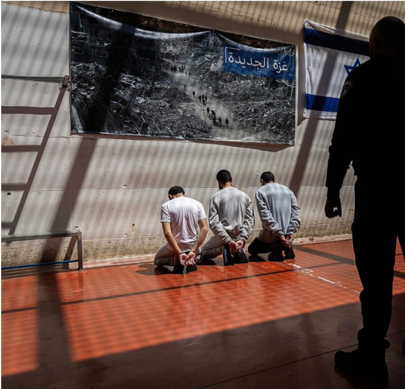
Des Palestiniens menottés sont contraints de s'asseoir devant une photo montrant les destructions causées par lâ??offensive israélienne sur la bande de Gaza et un drapeau israélien, dans une prison du centre dâ??Israël, le 6 mai 2025.