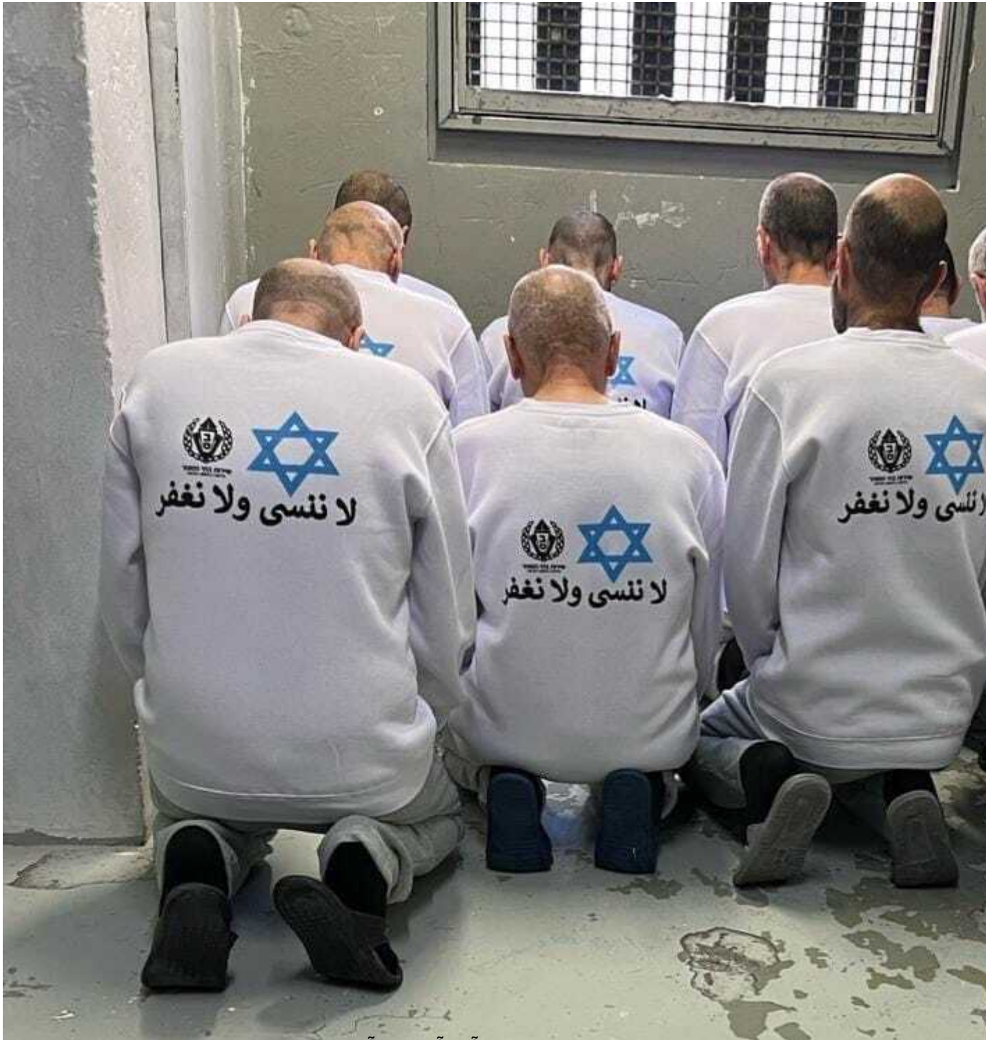
Prisonniers palestiniens sur le point d'être libérés. Ils portent des chemises IPS arborant le logo du service pénitentiaire, une étoile de David et la phrase en arabe : « Nous n'oublierons ni ne pardonnerons », 15 février 2025.