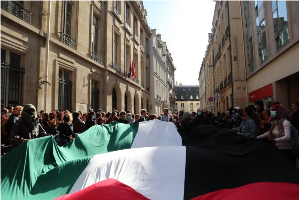
Le 1 er octobre 2024 devant lâ??universitÃ© de Science Po Paris