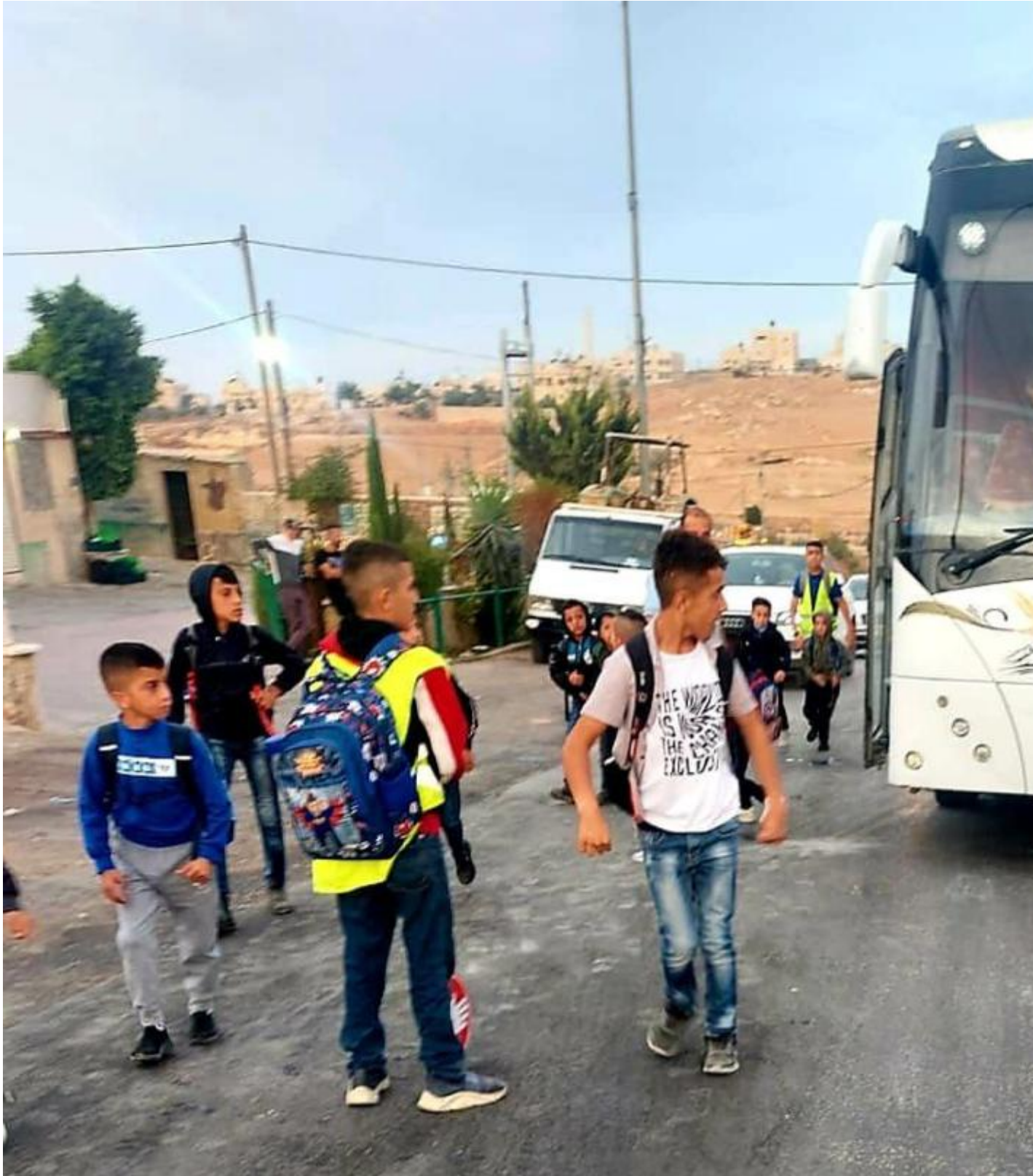
Masafer Yatta, des Ã©lÃ©ves d'Ã©cole