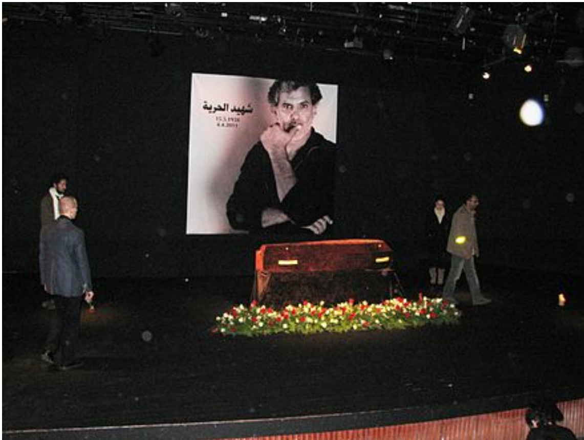
Photo et cercueil de Juliano Mer-Khamis, 2011

Ce single est un bel hommage à Juliano, qui restera l'une des voix les plus novatrices et inspirantes de la résistance palestinienne contre l'occupation militaire israélienne.