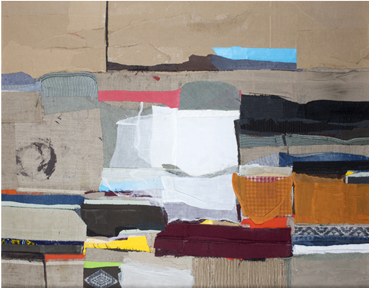
Mohamed Joha, Housing, 2018. Collection Musée d'art moderne et contemporain en Palestine, en dépôt à au musée de l'Institut du monde arabe, Paris.

Trois collections, trois récits, trois cas d'étude sur trois continents : l'origine et la diffusion de ces collections ont été fondamentalement des actes de résistance, de solidarité et d'espoir face au chaos et à la violence que chacun de ces territoires a traversés ou continue de vivre.