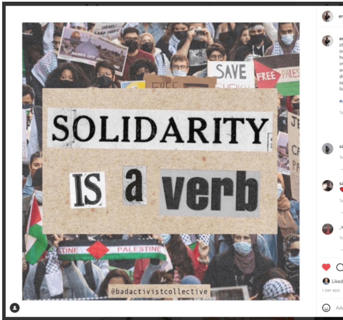
Post Instagram d'Emma Watson, le 3 janvier 2022.

Hier, l'actrice britannique Emma Watson, qui est une militante sur les questions de genre et a 64 millions de followers sur Instagram , a re-posté une image d'un rassemblement pour la Palestine en mai dernier avec le message : « Solidarité est un verbe » et une citation sur la solidarité de Sara Ahmed, universitaire féministe.