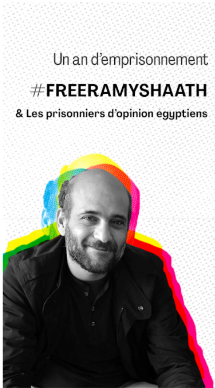
Couverture Instagram Story