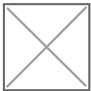
Image du film In Vitro (2019) de Larissa Sansour. Avec la permission de l'artiste et de Lawrie Shabibi

Dunia, la créatrice du verger, parle à celle qui va lui succéder, Alia, qui n'a jamais été au-dessus. Leur dialogue, puissant et émouvant, parle de la perte, la mémoire et l'exil en rapport avec l'occupation en Palestine.