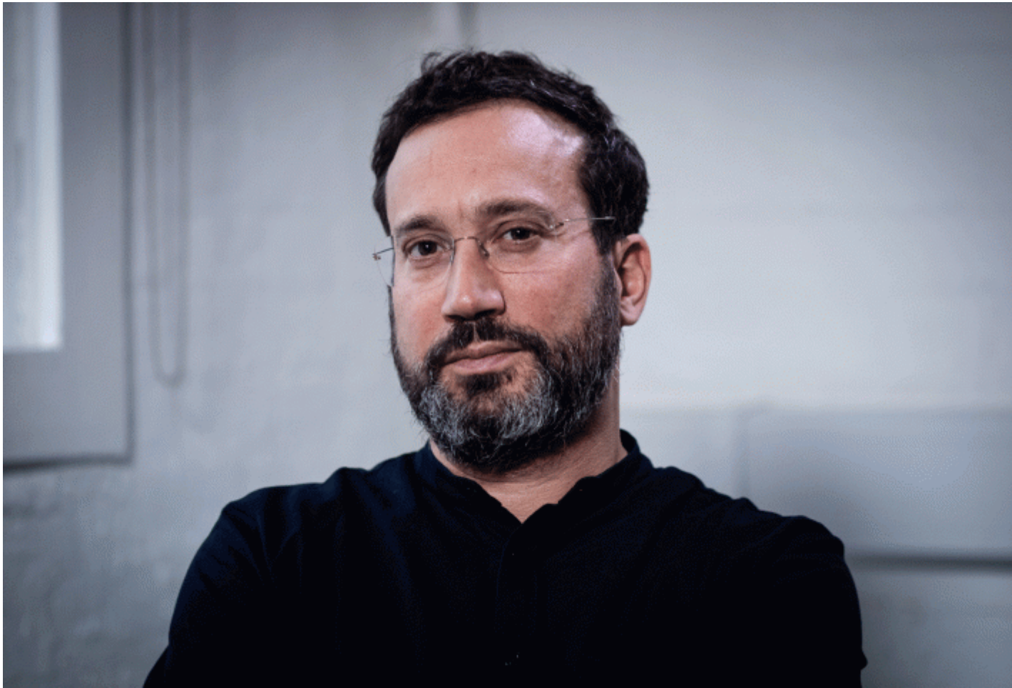
Eyal Weizman de Forensic Architecture

Eyal Weizman, le fondateur et directeur du groupe de recherche basé à Londres Forensic Architecture , a récemment aujourd'hui qu'il s'attendait vu refuser l'entrée aux Etats-Unis.