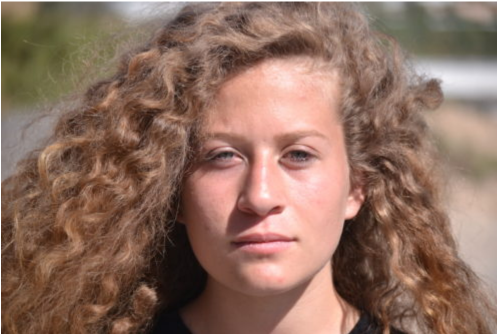
Ahed Tamimi