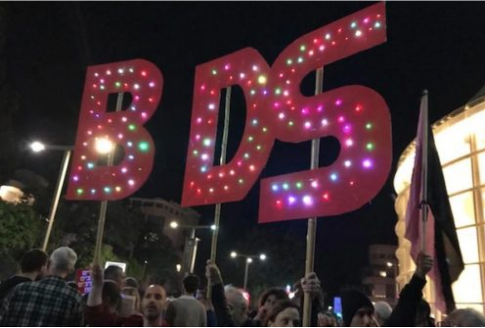
Des militants BDS israéliens participent à une manifestation anti-corruption, square Habima à Tel Aviv, le 9 décembre 2017 (Hagar Shezaf)

Selon les données publiées, la plus forte dépense du ministère des affaires stratégiques pour cette campagne est plus de 2,6 millions de NIS (614 000 $) à son budget pour promouvoir ces contenus sur les réseaux sociaux et moteurs de recherche, dont Google, Twitter, Facebook et Instagram. Une autre grosse somme, autour de 2 millions de NIS (480 300 $) a son budget pour la construction du site Act.il et pour l'alimenter en contenu. Un autre montant de peu près 490 000 NIS (117 700 $) a son budget pour la « stratégie », la « créativité » et la « labellisation ».