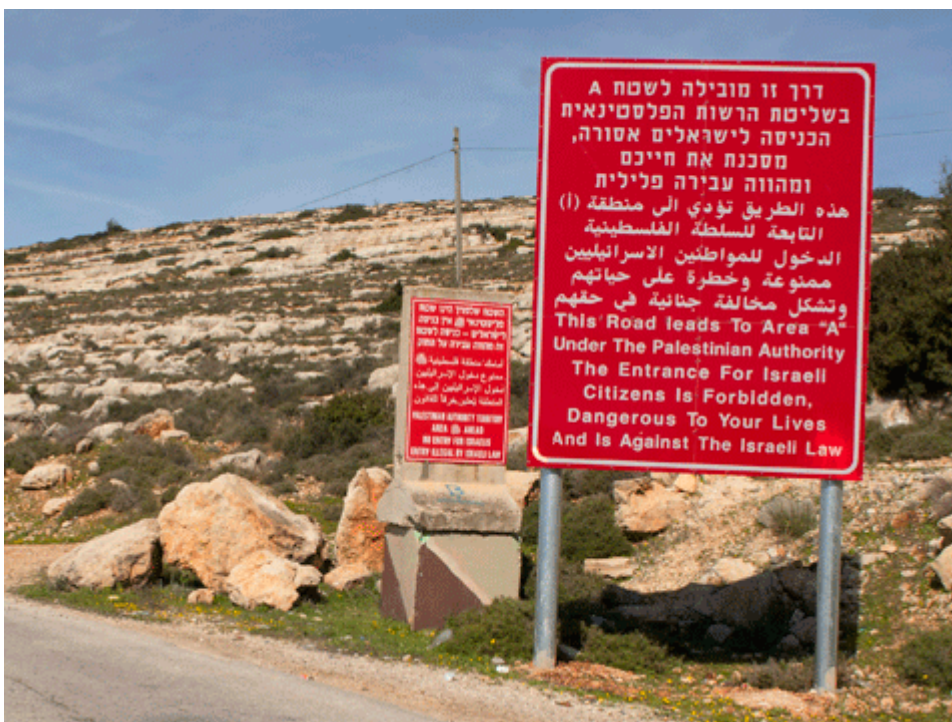
Signes en Cisjordanie avertissant les Israéliens de l'entrée en zone A.

Les Israéliens, selon les règlements israéliens, ne sont pas autorisés à visiter la « zone A » de la Cisjordanie, qui représente 18% du territoire de Cisjordanie et est la zone entièrement contrôlée par les Palestiniens. La photo ci-dessous montre le panneau à l'entrée de la zone A.