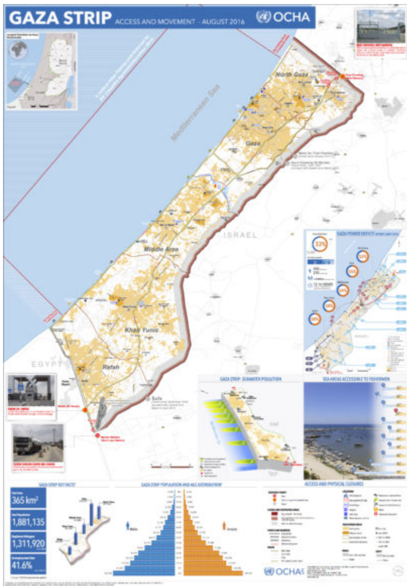
(Carte : United Nations)

La Bande de Gaza a une cÃ´te de 40 km le long de la MÃ©diterranÃ©e. Une consÃ©quence du blocus israÃ©lien dÃ¢?une dÃ©cennie et du pompage excessif dÃ¢?eau des aquifÃ©res souterrains, joints Ã un mauvais assainissement de la part de lâ?administration de Gaza et Ã une crise de lâ?Ã©lectricitÃ© est que la plage et la mer sont lourdement polluÃ©es.