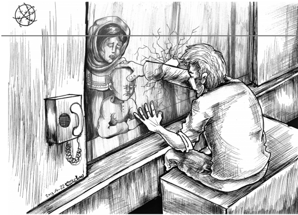
Cr dit : Mohammad Sabaaneh

  2017, avec la permission de Just World Publishing LLC.