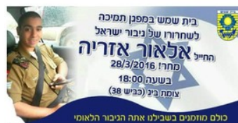
בית שמש במפגן תמיכה לשחרורו של גיבור ישראל החייל אלאור אזריה מחר ה 28/03/2016 בשעה 18:00 בצומת ביג (כביש 38) כולם מוזמנים בשבילנו אתה הגיבור הלאומי

Le site officiel de la municipalitÃ© de Beit Shemesh fait la pub dâ??un rassemblement de soutiens Ã Elor Azarya, qui a Ã©tÃ© filmÃ© exÃ©cutant un palestinien Ã bout portant.